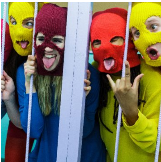
El punk feminista de Pussy Riot llega a Chile