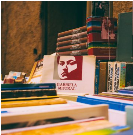
Una vuelta por la Feria del Libro Usado